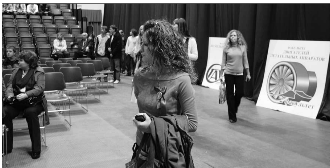
В этот день первокурсники познакомились со многими традициями нашего университета