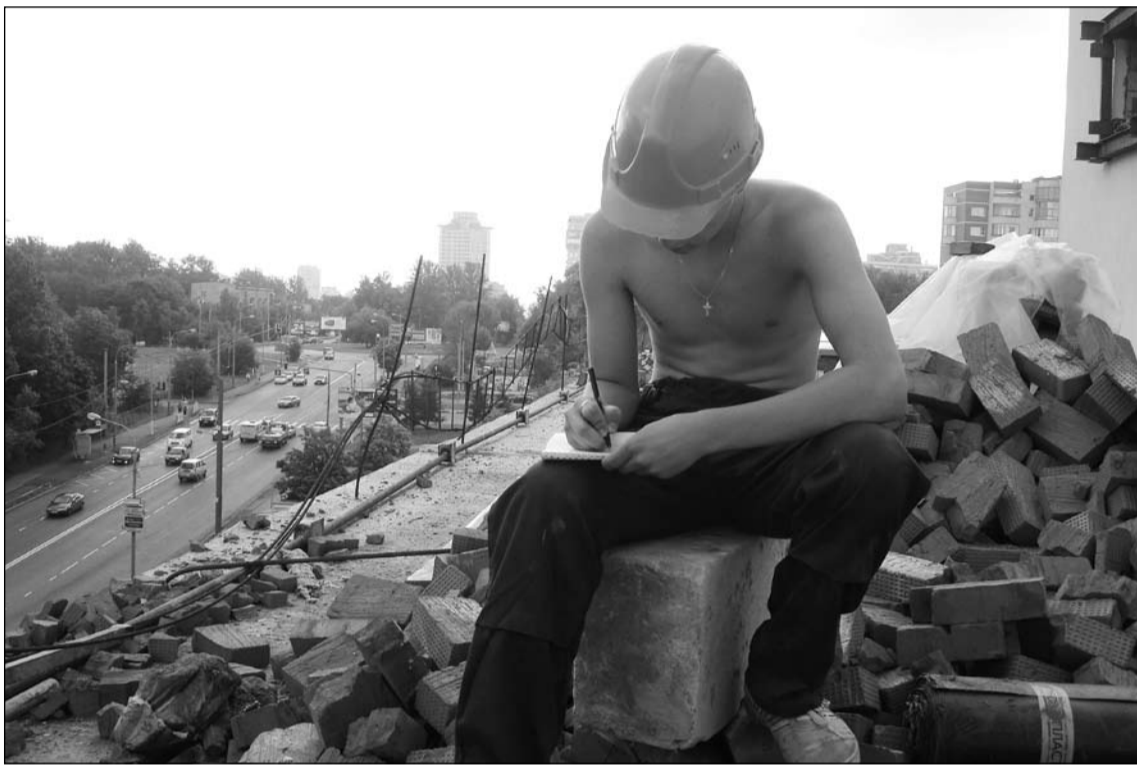
Заметки на фоне столичного пейзажа