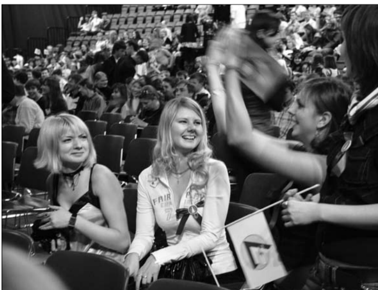
Энтузиазм и восторг первокурсниц