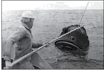
Так вылавливали «Зонд-5» моряки НИС «Боровичи».

23 сентября 1968 г. Советский Союз заявил о новой победе в космосе – первом в истории облёте Луны беспилотным космическим кораблем, «зашифрованным» как межпланетная станция «Зонд-5».