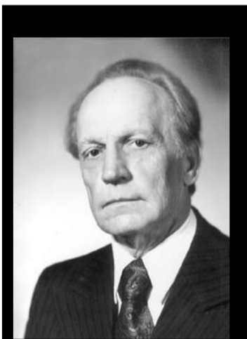
СКОНЧАЛСЯ АЛЕКСАНДР ФИЛИППОВИЧ БОЧКАРЁВ

Напомним, что параллельно с академической можно претендовать и на социальную, а также на стипендии различных фондов и прочие именные стипендии.