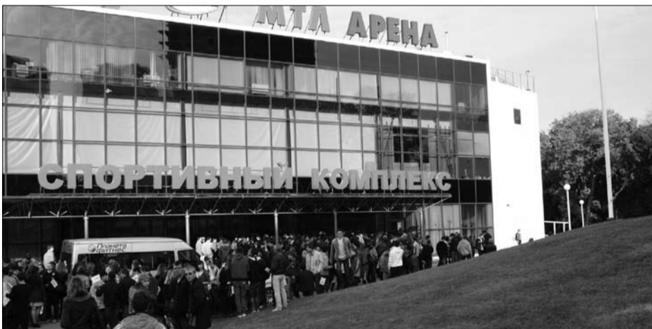
Нас так много, что поместиться можем только в «МТЛ-Арене»