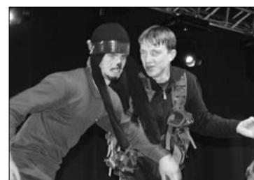
Завершил праздник марафон творческих коллективов